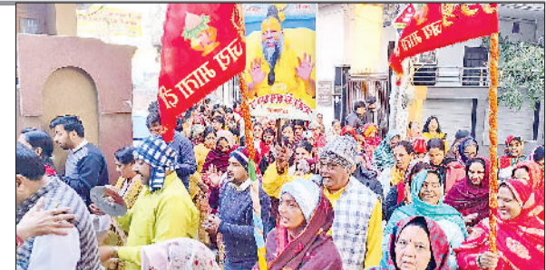
नारनौल। प्रभात फेरी निकालते श्रद्धालु।

दोबारा से शुरुवात कर दी गई है, जिनमें से एक प्रमुख कार्य अटेली राजकीय महाविद्यालय में 4.52 करोड़ की लागत से मल्टीपुर्पज हॉल के निर्माण हेतु टेंडर आमंत्रित किए गए हैं, जो कि आने वाले समय में क्षेत्र के युवाओं के भविष्य निर्माण में मील का पत्थर साबित होंगे।