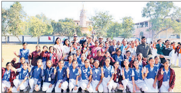
रेवाड़ी। खेल उत्सव में अतिथियों व शिक्षकों के साथ छात्राएं।