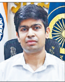
डीसी अभिषेक मीणा।

दुर्घटना में घायल या मरने वाले के परिजनों के लिए पांच लाख रुपये तक की आर्थिक सहायता दी जाएगी