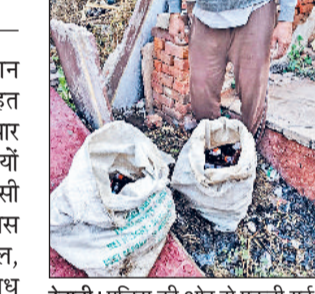
रेवाड़ी। पुलिस की ओर से पकड़ी गई अवैध शराब।

पुलिस की ओर से ऑपरेशन हॉटस्पॉट डोमिनेशन के तहत जुआ-सट्टा, नशा व अवैध हथियार सहित अन्य अवैध गतिविधियों संलिप्त आरोपियों पर नकेल कसी जा रही है। अभियान के तहत पुलिस की विभिन्न टीमों संवेदनशील, भीड़भाड़ वाले तथा अपराध प्रभावित क्षेत्रों में जांच कर रही है। अभियान के दौरान पुलिस ने जुआ-सट्टा व अवैध रूप से शराब बचने वालों पर कार्रवाई करते हुए सफलता हासिल की है। शहर थाना पुलिस ने सट्टा खाईवाली करते हुए