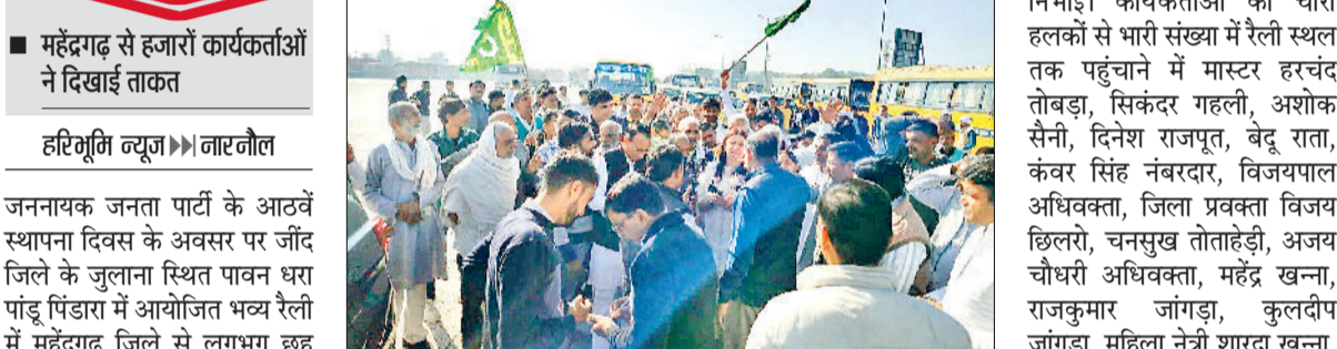
नारनौल। रैली में भाग लेने के लिए रवाना होते जेजेपी कार्यकर्ता।