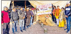
नारनौल। गोवंश के लिए सवामणी लगाते हुए।