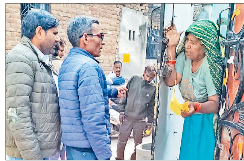
रेवाड़ी। लार्वा मिलने पर नोटिस देते हुए स्वास्थ्यकर्मी।

घरों में लार्वा की जांच की जा चुकी है। स्वास्थ्य विभाग की ओर से इस वर्ष में अब तक डेंगू संभावित 4557 लोगों के ब्लड सैंपल लिए जा चुके हैं तथा घरों में लार्वा मिलने पर 3939 लोगों को नोटिस दिए गए हैं। इस वर्ष प्राइवेट लैबों से 227 डेंगू मरीजों व सरकारी लैब से 71 मरीजों की पुष्टि की गई है।