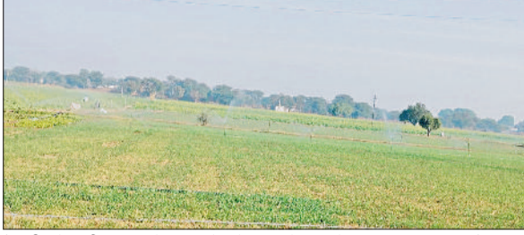
रेवाड़ी। गेहूं की सिंचाई के लिए खेत में चल रहे फवारे तथा रविवार शाम को आसमान में छाए बरसात के बादल।

दिसंबर माह का पहला सप्ताह बीत जाने के बाद भी मौसम में बदलाव नहीं आया है। दो दिन तक आसमान में बादल और बूंदबांदी की संभावनाओं पर पानी फिर चुका है। इस समय किसानों को फसल सिंचाई के लिए बिजली की ज्यादा दरकार है। ठंड के साथ बिजली की मांग बढ़कर 75 लाख यूनिट तक पहुंच गई है, जिसके अगले सप्ताह तक और बढ़ने के आसार हैं। कड़ाके की ठंड में उपभोक्ताओं को पीक अवर्स में पावर कटों का सामना भी करना पड़ सकता है। रविवार को शाम के समय मौसम में अचानक बदलाव आ गया। आसमान में बादल छाने के बाद ठंड का प्रकोप बढ़ने के आसार बन गए। मौसम विभाग की ओर से अनुमान लगाया गया था कि गत शनिवार से दो दिन तक मौसम में