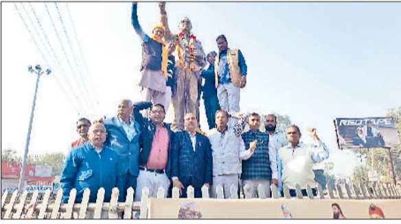
रेवाड़ी। ड. अंबेडकर को श्रद्धांजलि अर्पित करते हुए।

इसके बाद आसमान में बादल छाने और बूंदबांदी होने की संभावना जताई जा रही है। दिन के तापमान में भी तेज धूप के चलते अभी ज्यादा गिरावट आने की संभावना नहीं है, जिससे कड़ाके की ठंड का असर रात के समय ही ज्यादा रह सकता है। रविवार को शाम के समय अचानक बादल छाने से बूंदबांदी और ठंड बढ़ने की संभावना नजर आने लगी।