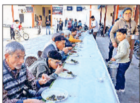
महेंद्रगढ़। भंडारे में प्रसाद ग्रहण करते श्रद्धालु।