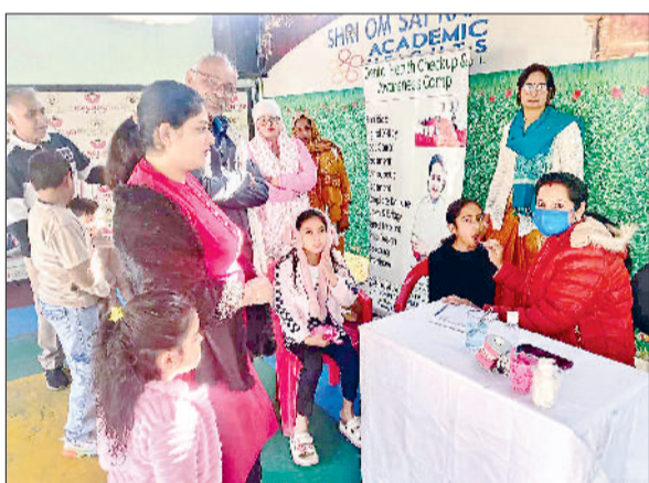
महेंद्रगढ़। शिविर में मौजूद चिकित्सक।