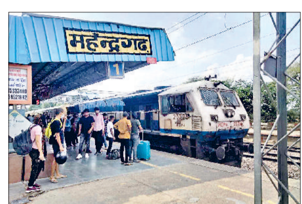
महेंद्रगढ़। रेलवे स्टेशन महेंद्रगढ़।

जएगी। इसे 'अतिक्रमण' या 'अवैध प्रवेश' का दर्जा दिया जाएगा। ट्रेस पासर अभियान सिर्फ जागरूकता फैलाने तक सीमित नहीं रहेगा, बल्कि सख्त कानूनी कार्रवाई भी करेगा। रेलवे ट्रैक पार करते पकड़े जाने पर एक हजार रुपये तक का जुर्माना या छह महीने की कैद की सजा हो सकती है। चुनार हादसा के बाद एनसीआर ने उठाया यह सख्त कदम उठाया है। हर बड़े रेलवे स्टेशन पर सतर्कता