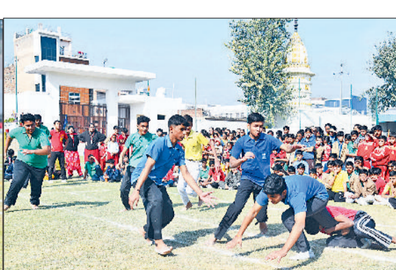
रेवाड़ी। खेल महोत्सव के समापन पर डांस पेश करती छात्रा, कबड्डी प्रतियोगिता में भाग लेते हुए विद्यार्थी।