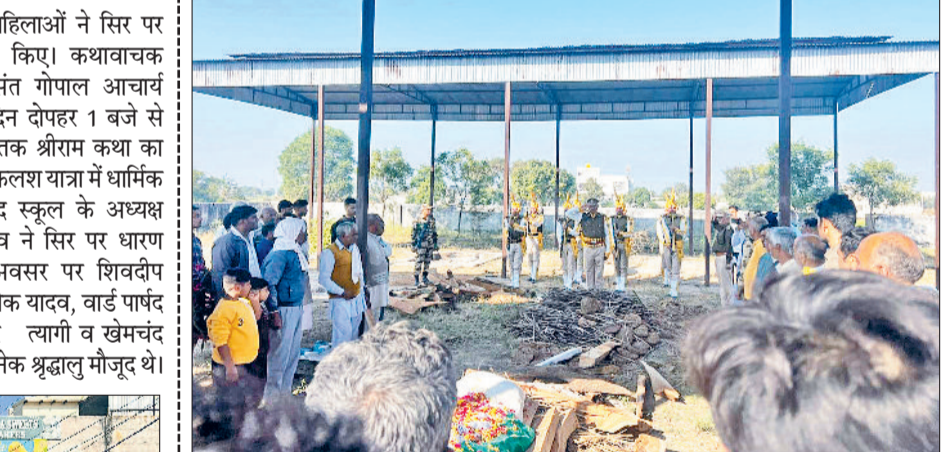
रेवाड़ी। सीआईएसएफ के जवान को सलामी देते हुए।