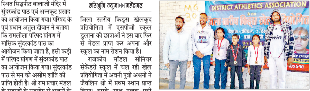
महेंद्रगढ़। विजेता बच्चों को मेडल पहनाकर सम्मानित करते हुए।